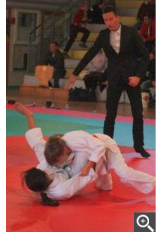
Les judokas se sont fait avant tout plaisir sur les tatamis.